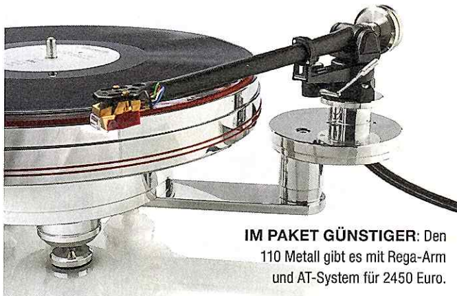
IM PAKET GÜNSTIGER: Den 110 Metall gibt es mit Rega-Arm und AT-System für 2450 Euro.